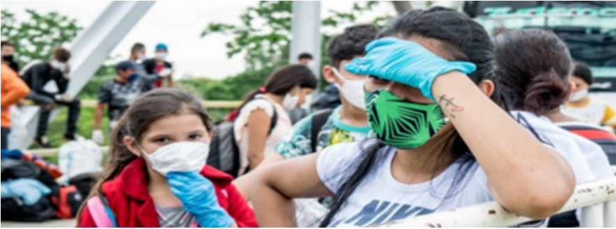
Figura 1. Sociedad Resiliente

Este tipo de resiliencia se presenta ante impactos sociales como atentados, conflictos colectivos, terremotos, inundaciones, pandemias, de la misma manera una represión política y otras, que afectan a la sociedad en general.