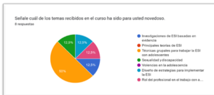
Figura 2. Tema recibido en el curso más novedoso.

(Gráfica descargada en cuestionarios de Google)