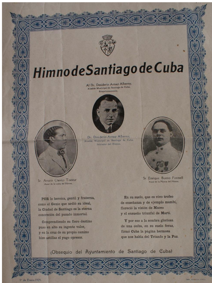
Figura 1: Letra del himno de Santiago de Cuba y autores

Su estreno tuvo lugar a las cinco de la tarde del día 18 de noviembre de 1928 en el salón de sesiones del Ayuntamiento de Santiago de Cuba, a cargo de la Banda Municipal de Música bajo la dirección del maestro Bueno Formell, según consta en la publicación del periódico La Independencia del siguiente día. Las particellas utilizadas en esa interpretación musical, tienen indicada la fecha del 20 de septiembre del propio año, por lo que se infiere que el himno fue compuesto en esa fecha. Estas se conservan en el archivo de la Banda Provincial de Concierto, centenaria institución que prestigia nuestra ciudad [7]. En aquel momento se dispuso que “fuera cantado el 31 de diciembre de cada año. Se desconocen las razones por las que el canto no formó parte de la tradición de