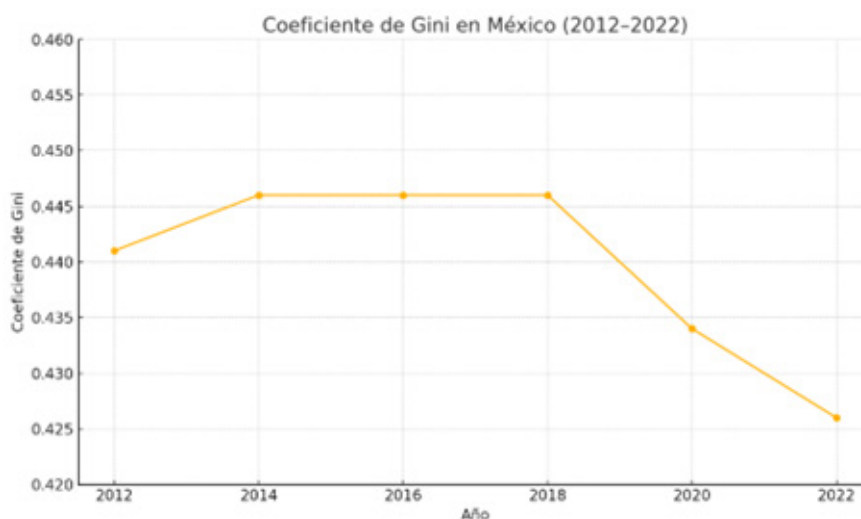
Gráfica No. 3. Coeficiente de Gini. 2012-2022

Fuente: elaboración propia con datos aplicados