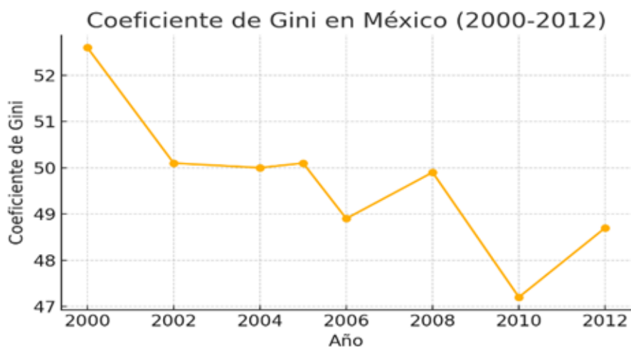
Gráfica No. 1. Coeficiente de Gini en México (2000-2012)

Fuente: elaboración propia con datos aplicados