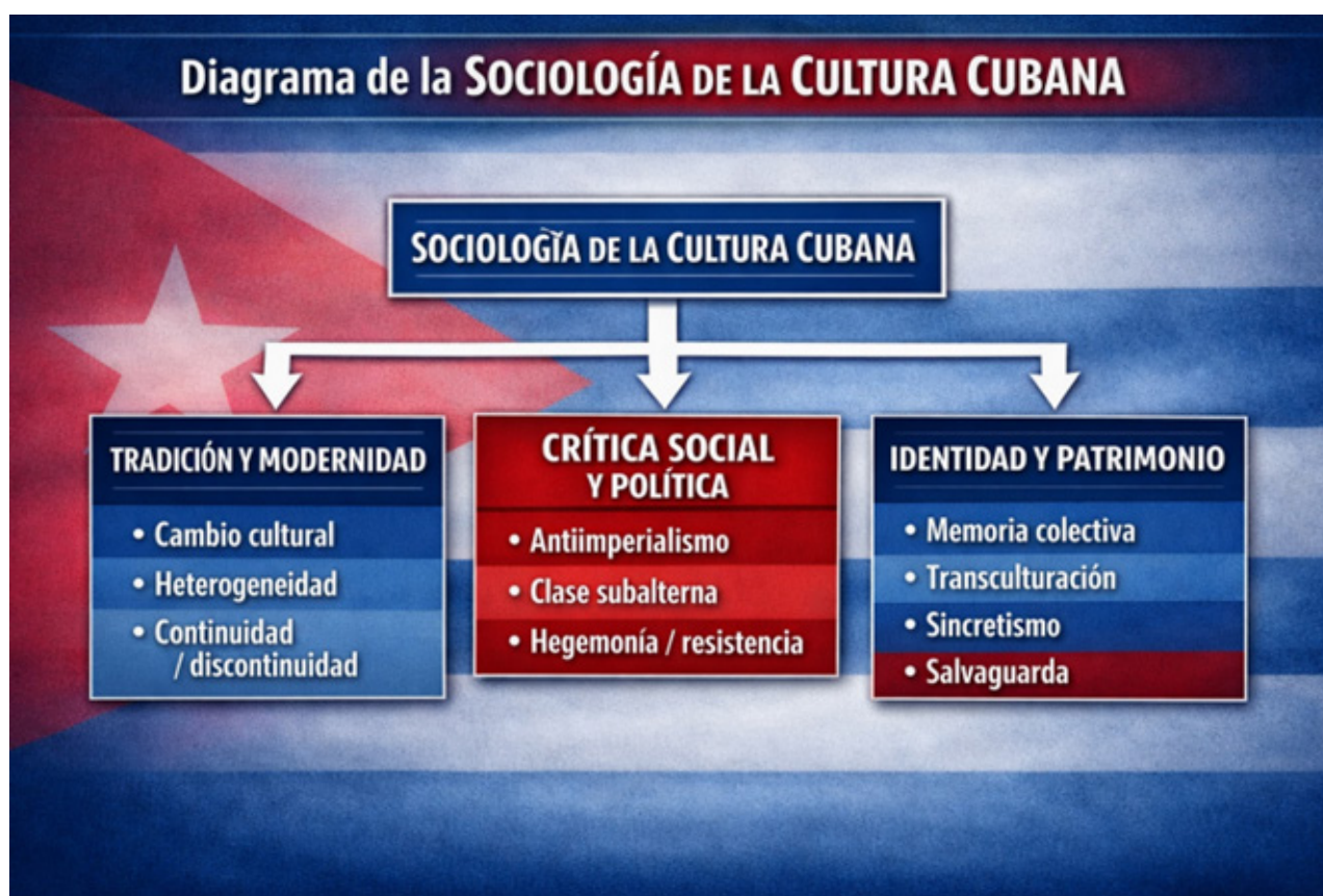
Figura 4. Articulación de los referentes teóricos en la sociología de la cultura cubana