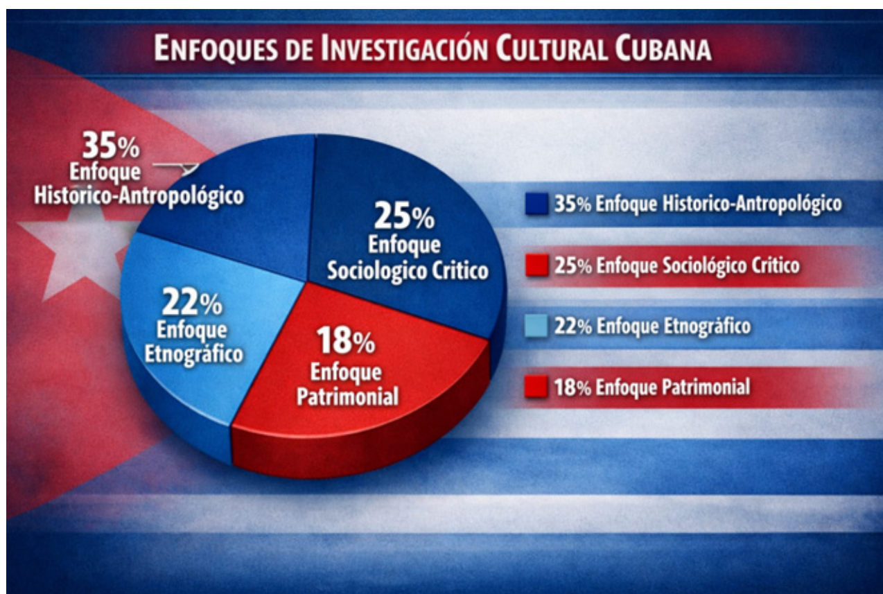
Figura 3. Distribución de enfoques metodológicos en los artículos sistematizados

La diversidad de enfoques refleja la complejidad de las fiestas populares como fenómeno sociocultural que, como señala Escudero (2017), "contiene en sí la potencialidad de reforzamiento de lo comunitario en la práctica social" (p. 30). Los investigadores coinciden en que las fiestas permiten analizar "el fenómeno festivo a partir de las formas de realización constatables en expresiones discursivas presentes en la realidad y la orientación de los epistemes comunitarios en acciones específicas de la celebración" (Escudero, 2017, p. 30).