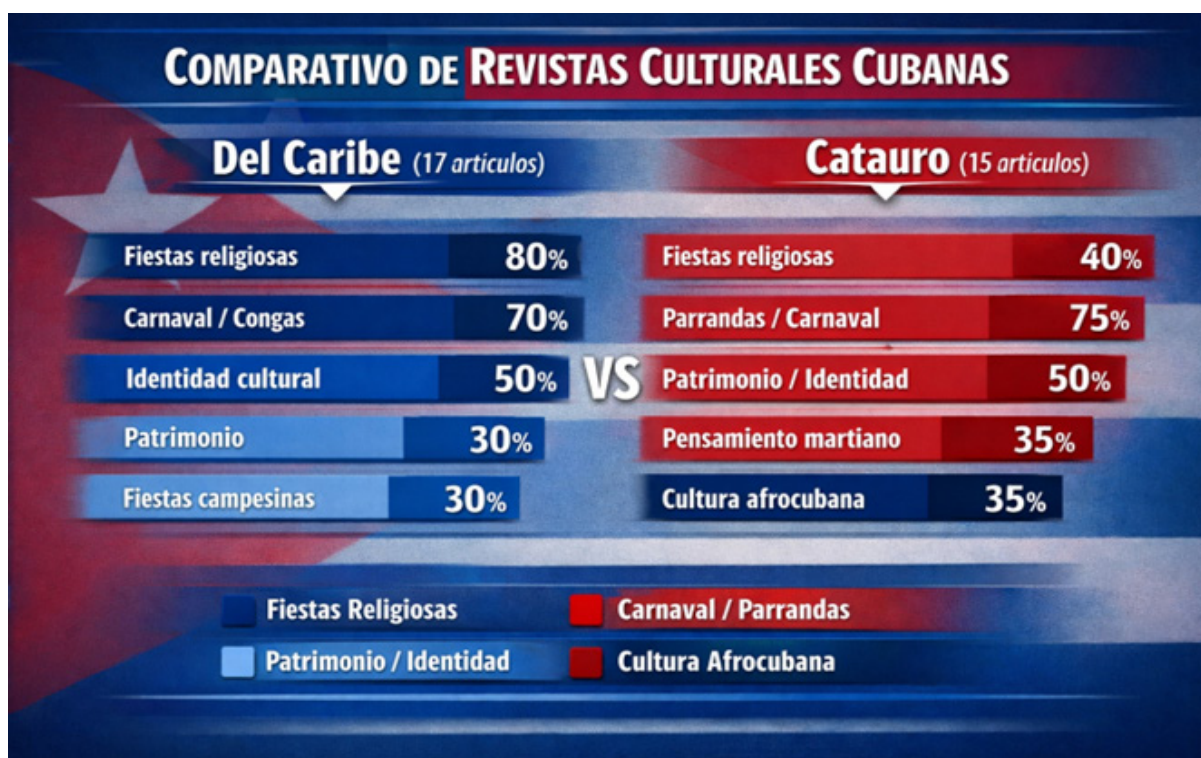
Figura 1. Distribución temática de artículos sistematizados en Del Caribe y Catauro (2000-2019)