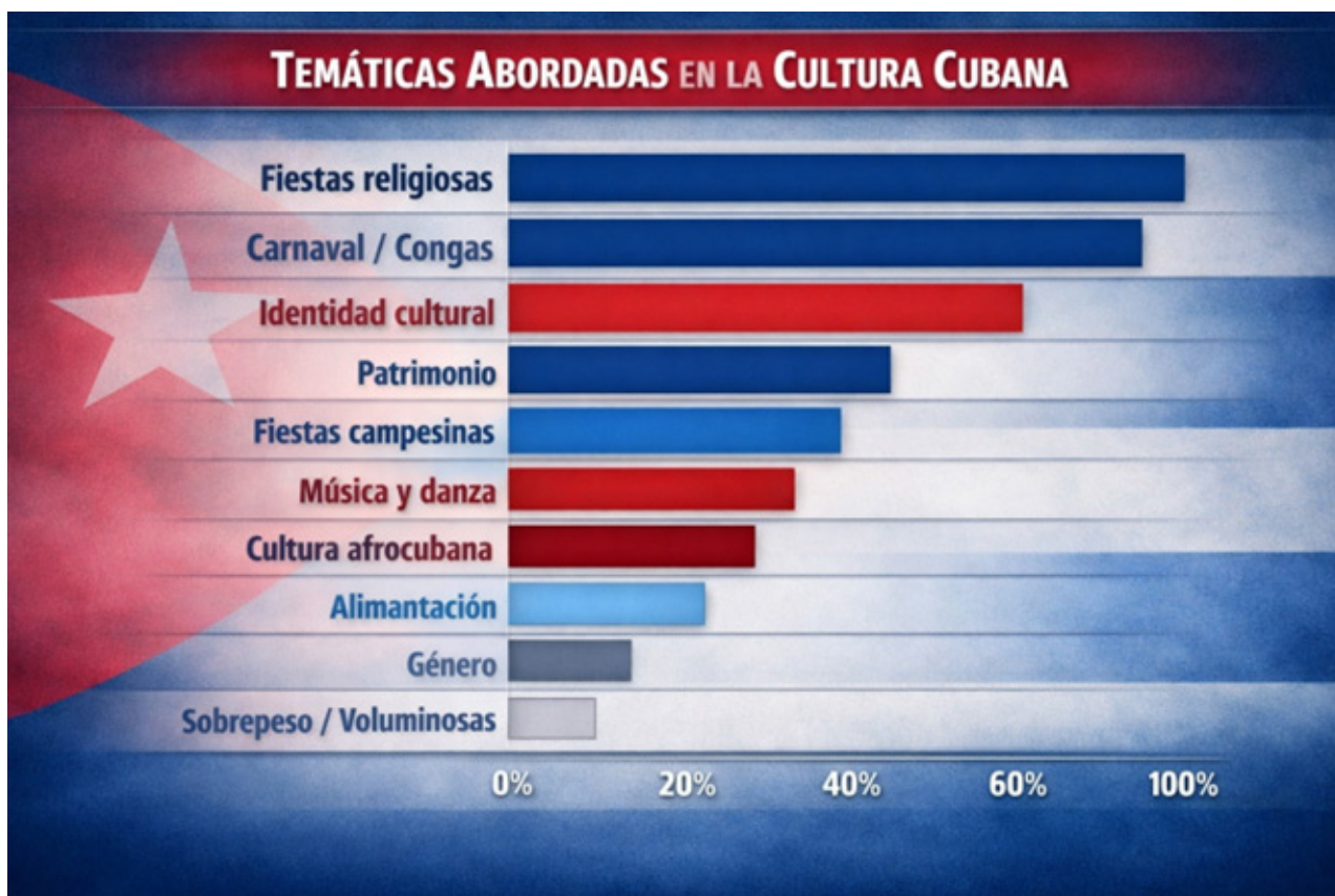
Figura 5. Vacíos temáticos en la producción investigativa sobre fiestas populares

Este vacío resulta especialmente significativo a la luz del surgimiento en 2010 del proyecto "Las Voluminosas", que ha constituido un suceso sociocultural en los carnavales de Santiago de Cuba y La Habana. Este grupo de mujeres con sobrepeso ha roto cánones de belleza establecidos, demostrando que "la belleza no es sinónimo a esbeltez ni a talla sino que la belleza es sinónimo de alegría" (Martínez, 2022, comunicación personal). La ausencia de estudios sobre este fenómeno en las revistas sistematizadas evidencia la necesidad de ampliar la agenda de investigación sociológica hacia temas emergentes que desafían los estereotipos culturales. Como ha señalado el Dr. Carlos Lloga (2022), "las voluminosas son un proyecto liberador de la mujer sobre todo en el carnaval por la razón que a la mujer se le juzga por su cuerpo" y "abren una puerta a todas las demás mujeres que no tienen el cuerpo del esquema". Este fenómeno, que comenzó en 2010 y ha trascendido fronteras, merece ser documentado y teorizado desde la sociología de la cultura cubana.