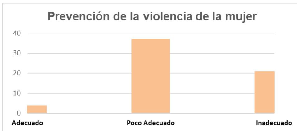
Figura 2. Estado actual de la Prevención de la violencia de la mujer